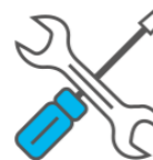
Service & Onderhoud