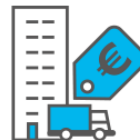
Vaste activa / Investerings