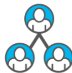
Leden / Donateurs