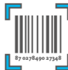
Artikelen / Voorraad