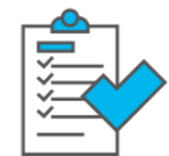
Werkorders / Helpdesk